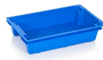
Laatikko Tuotekoodi: 0146 Valmistajatunnus: EP

Kuvaus: Kapasiteetti 17 l, suljettu rakenne. Tuotesovellukset: liha- ja siipikarjatuotteet, teollisuuden käyttö, varastointi.