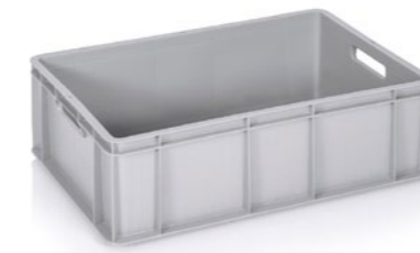
Muovilaatikko Tuotekoodi: 0154 Valmistajatunnus: EP

Kuvaus: Akkukäyttöinen sidontakone mm. PP- ja PET-hihnalle. Sis. ITA 21 + 1 akku + 1 akkulaturi