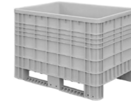
Muovisäiliö jalaksilla Tuotekoodi: 07.18.000.00 Valmistajatunnus: CP

Kuvaus: HDPE-muovista valmistettu 600 l säiliö jalaksilla.