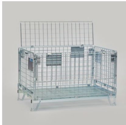
Turvahäkki TFH75 Tuotekoodi: 233.000.00.Z Valmistajatunnus: IF

Häkit | Kuljetus- ja siirtoalustat | Laatikot ja säilytysalustat | Sidontakoneet Juomatuotteiden varastointi ja kuljetus