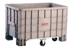
Muovisäiliö teräksisellä pyöräalustalla Tuotekoodi: 07.15.000.00 Valmistajatunnus: EP

Kuvaus: Elintarvikemuovia, 600 l säiliö.