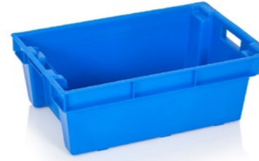
Laatikko Tuotekoodi: 0113 Valmistajatunnus: EP

Kuvaus: Kapasiteetti 30 l, suljettu rakenne. Tuotesovellukset: liha, kala, teollisuuden käyttö, varastointi, logistiikka.