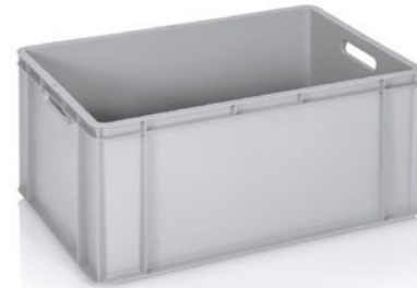
Muovilaatikko Tuotekoodi: 0163 Valmistajatunnus: EP

Kuvaus: Kapasiteetti 60 l, kiinteät pohja ja seinät.