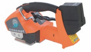
Vannekone ITA 21 Tuotekoodi: T2199971 Valmistajatunnus: IT

Kuvaus: Akkukäyttöinen sidontakone mm. PP- ja PET-hihnalle. Sis. ITA 21 + 1 akku + 1 akkulaturi