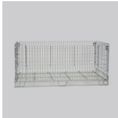
Metallilankahäkki ECOH1000 Tuotekoodi: 209.000.00.Z Valmistajatunnus: IF