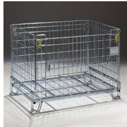
Metallilankahäkki 80 Tuotekoodi: 05.11.000.00.R Valmistajatunnus: CP