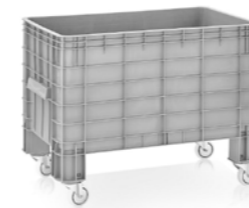
Pyörällinen laatikkolava Tuotekoodi: 3454 Valmistajatunnus: EP

Kuvaus: Akkukäyttöinen sidontakone mm. PP- ja PET-hihnalle. Sis. ITA 25 + 1 akku + 1 akkulaturi.