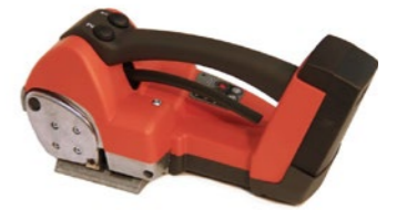
Vannekone ITA 25 Tuotekoodi: T259997 Valmistajatunnus: IT

Kuvaus: Akkukäyttöinen sidontakone mm. PP- ja PET-hihnalle. Sis. ITA 25 + 1 akku + 1 akkulaturi.